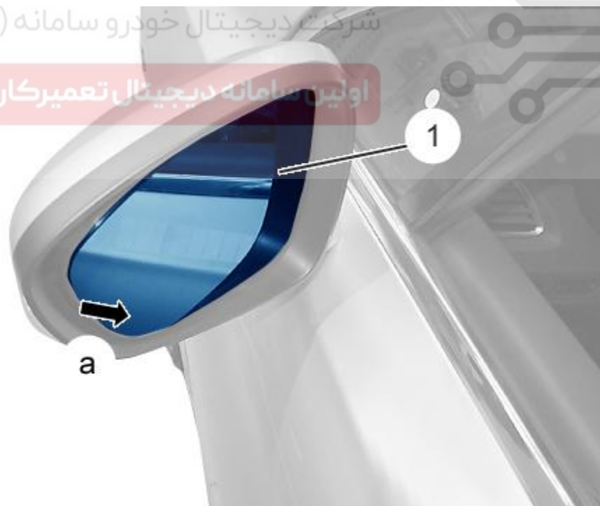
شکل C4CG0E4D :

موقعیت شیشه اینه نمای عقب بیرونی (۱) را تنظیم کنید (در نقطه a) اتصالات باتری را جدا کنید.