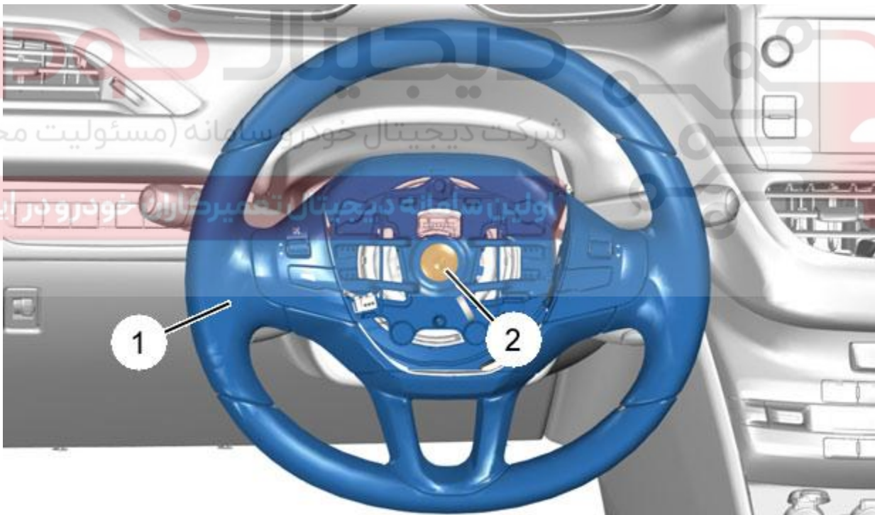
شکل : B3EG0MSD